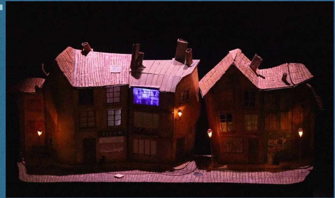
Décor entier du Faubourg

Au delà de poser l'univers esthétique et l'ambiance, le décor est pensé comme le castelet et le terrain de manipulation du spectacle. Les fenêtres permettent de voir en ombres et en marionnettes la vie des personnages de l'histoire.